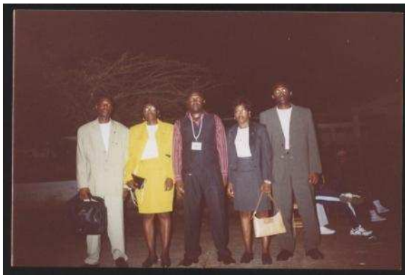
← Le président de JP-APT avec le personnel du CAPT Cameroun inc. lors de la soirée de clôture des activités.