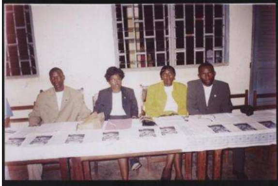
← Employés du CAPT Cameroun inc. invités à la soirée de clôture des activités de JP-APT au mois de mars 2006.